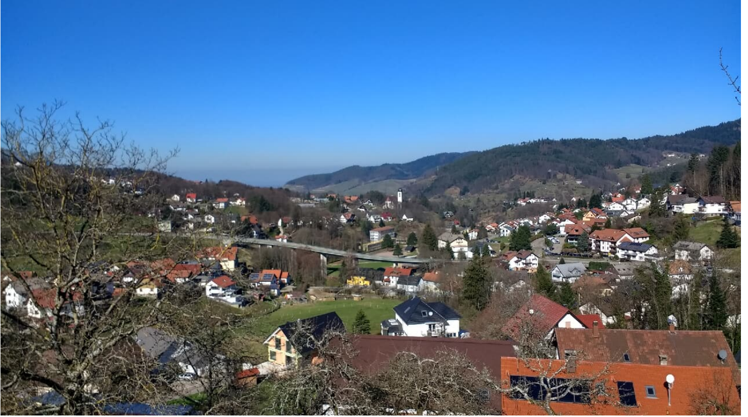
Obertal Längenberg