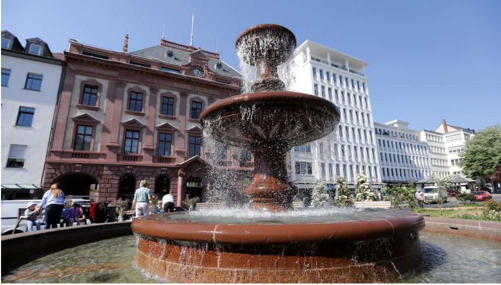
Bad Homburg - Kurhaus Brunnen