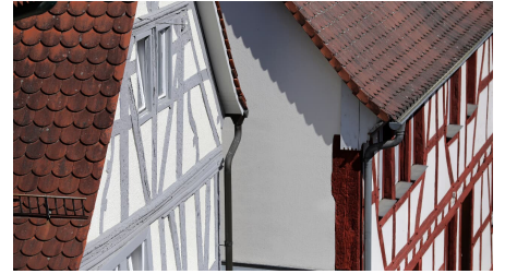
180HR - Bad Homburg - Altstadt.JPG