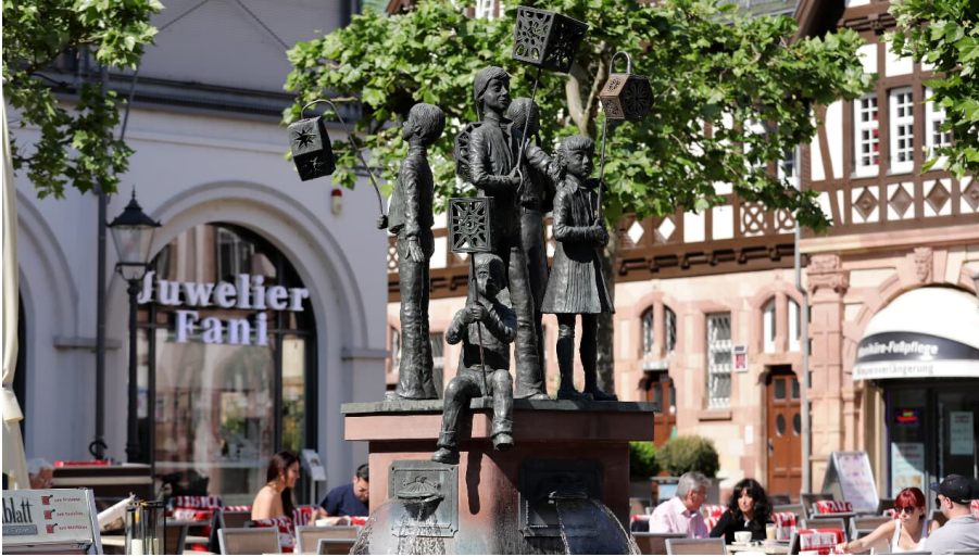
Bad Homburg v. d. Höhe - Louisenstraße