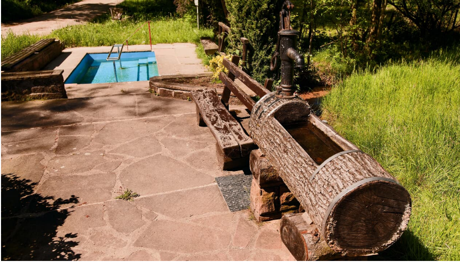
Grasellenbach Tretbecken klein.jpg