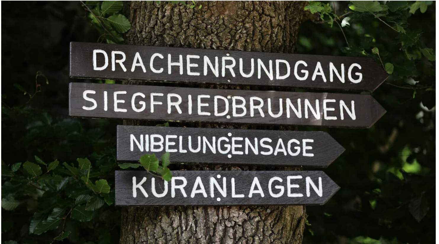
012HR - Grasellenbach - Wegezeichen.JPG

Bewegungstherapie, Ernährungstherapie, Hydrotherapie, Ordnungstherapie, Phytotherapie