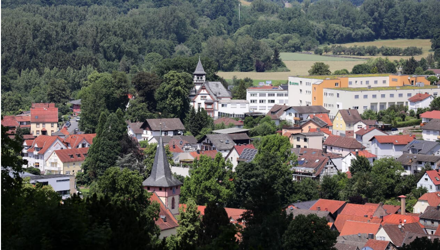
Bad König - von oben