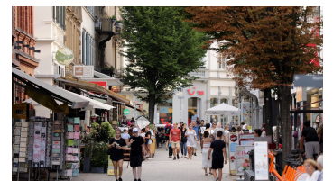
190HR - Wiesbaden - Kirchgasse.JPG