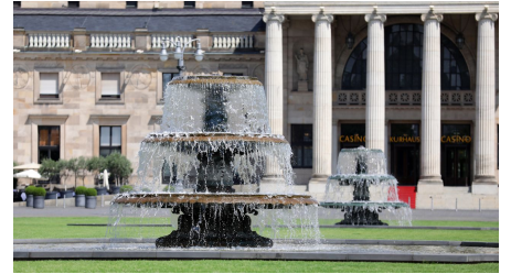
119HR - Wiesbaden - Kurhaus Bowling Green.JPG