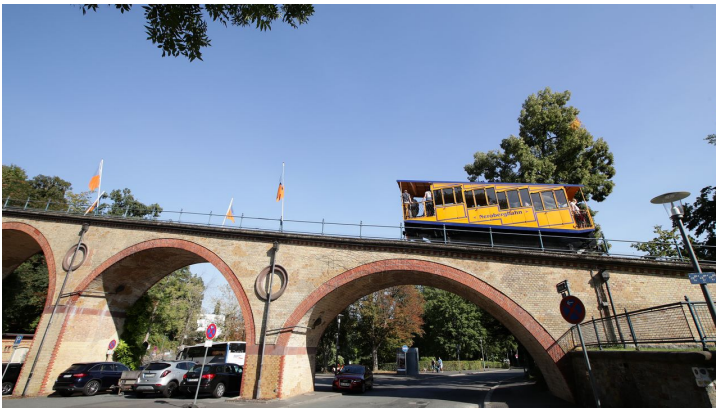
143HR - Wiesbaden - Nerobergbahn.JPG