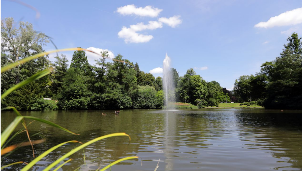
084HR - Wiesbaden - Kurpark Teich.JPG