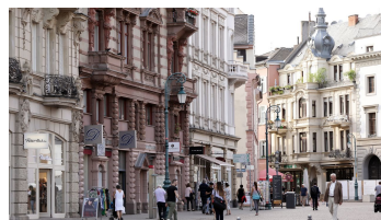
189HR - Wiesbaden - Kirchgasse.JPG