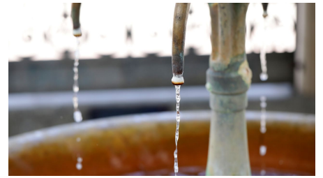
132HR - Wiesbaden - Brunnen Kochbrunnen.JPG