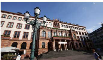
184HR - Wiesbaden - Rathaus.JPG - © Heiko Rhode