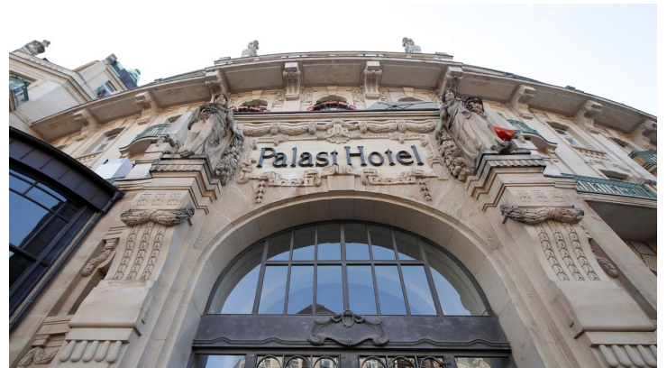
176HR - Wiesbaden - Kureck Palasthotel.JPG