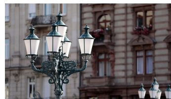
183HR - Wiesbaden - Kureck.JPG