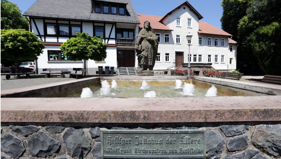
073HR - Herbstein - Brunnen Heiliger Jakobus.JPG