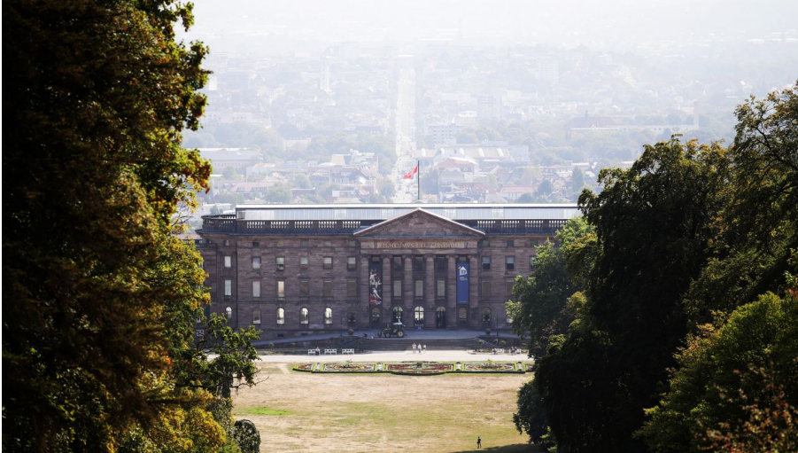
Bergpark Bad Wilhelmshöhe