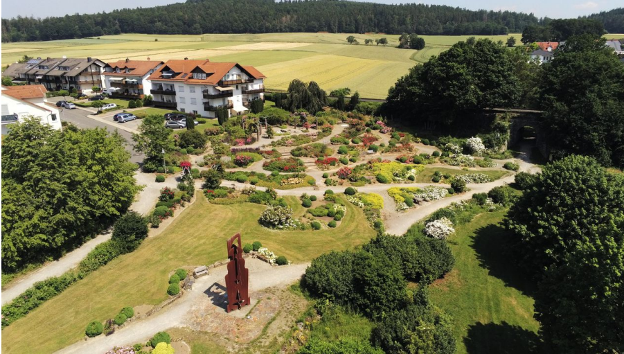
Bad Emstal - Kurpark Rosengarten von oben