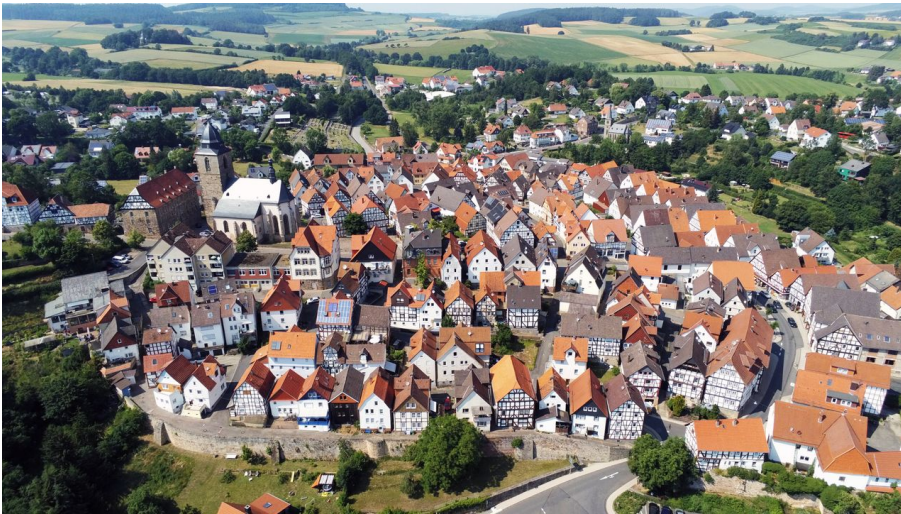
Naumburg von oben