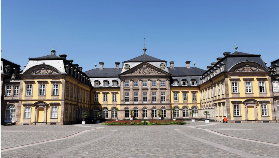
Bad Arolsen - Residenzschloss Arolsen