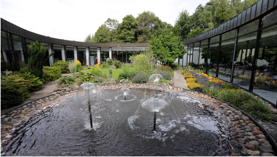
Bad Wildungen - Kurpark Wandelhalle Reinhardshausen Brunnen