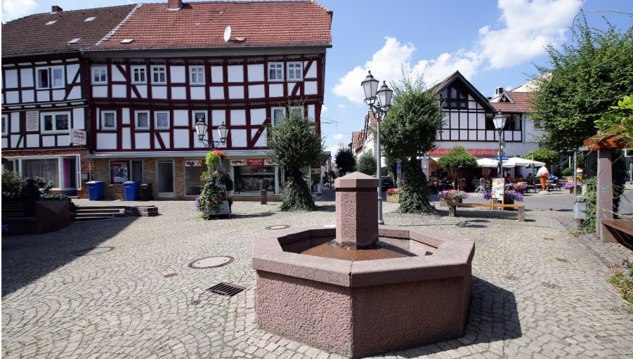
Neukirchen - Fußgängerzone Brunnen