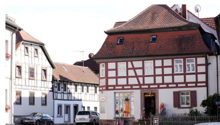
044HR - Gersfeld - Fachwerk.JPG