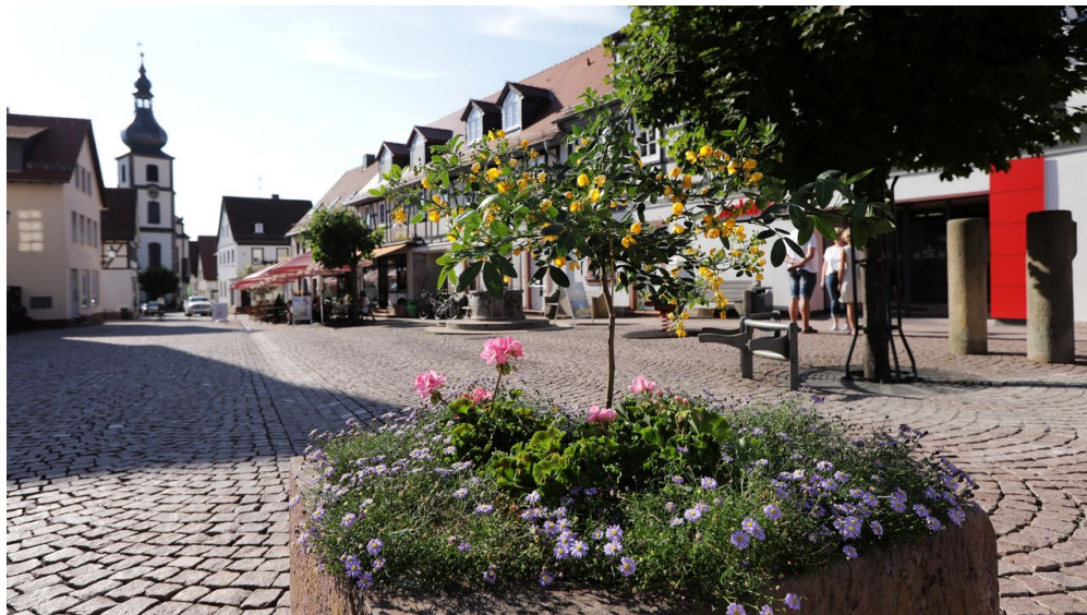
056HR - Gersfeld - Fußgängerzone.JPG

Gesundheitswandern, Massage, Physiotherapie