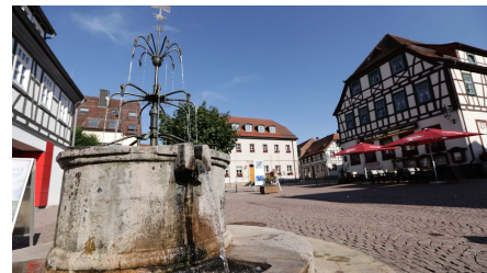
049HR - Gersfeld - Brunnen.JPG