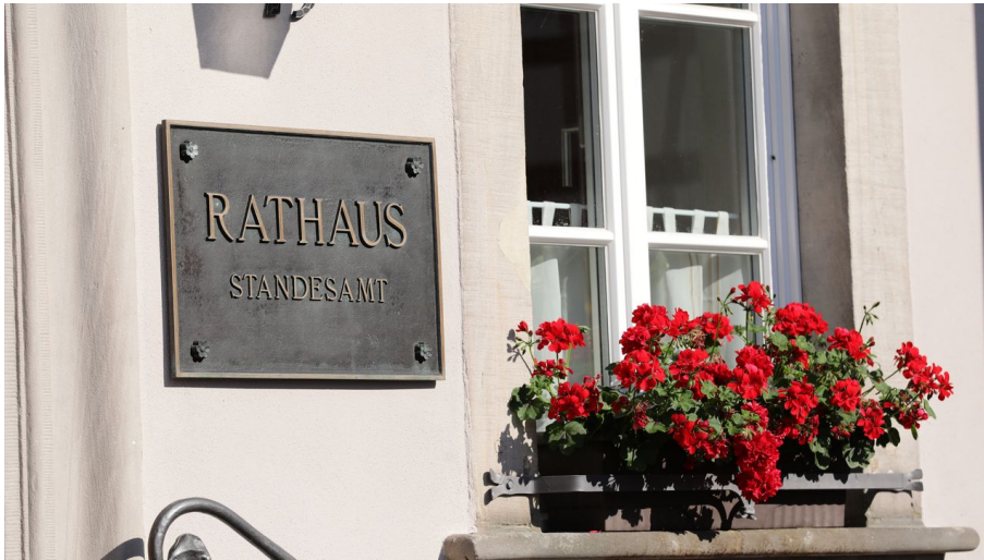
045HR - Gersfeld - Rathaus Schild.JPG - © Heiko Rhode