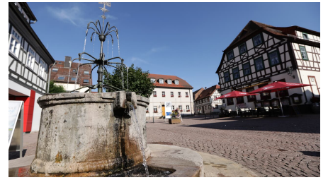
049HR - Gersfeld - Brunnen.JPG