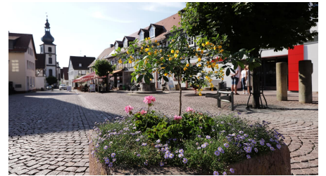
056HR - Gersfeld - Fußgängerzone.JPG