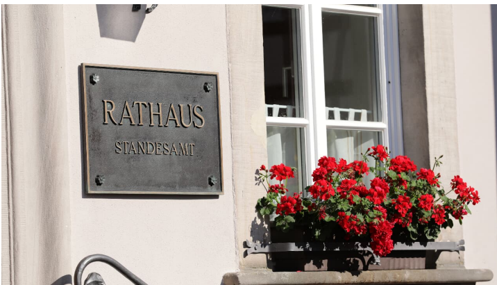
045HR - Gersfeld - Rathaus Schild.JPG