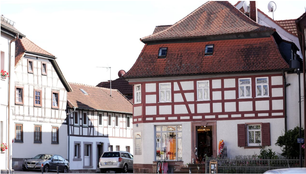
044HR - Gersfeld - Fachwerk.JPG