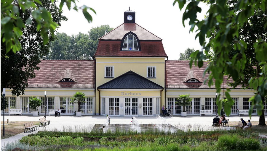
Kurhaus Bad Hersfeld