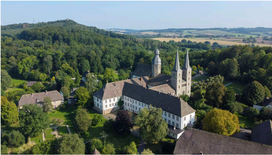
Luftbild Abtei Marienmünster