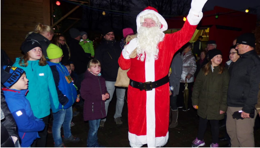
Nikolausmarkt in Vreschen-Bokel - © Klaus Dumrath