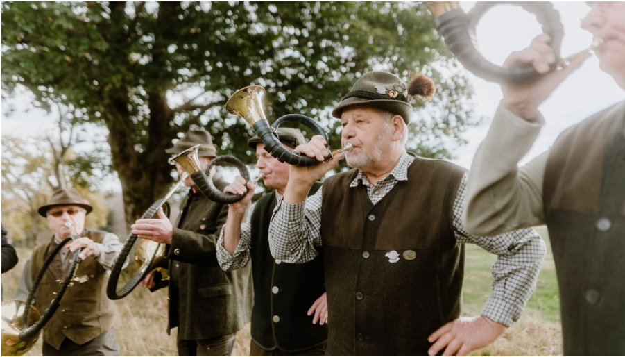
Jagdhornbläser beim Schierker Kuhball