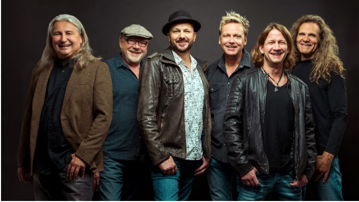
Blaeck-Foeoess-Thomas-Ahrendt.jpg - © Thomas Ahrendt