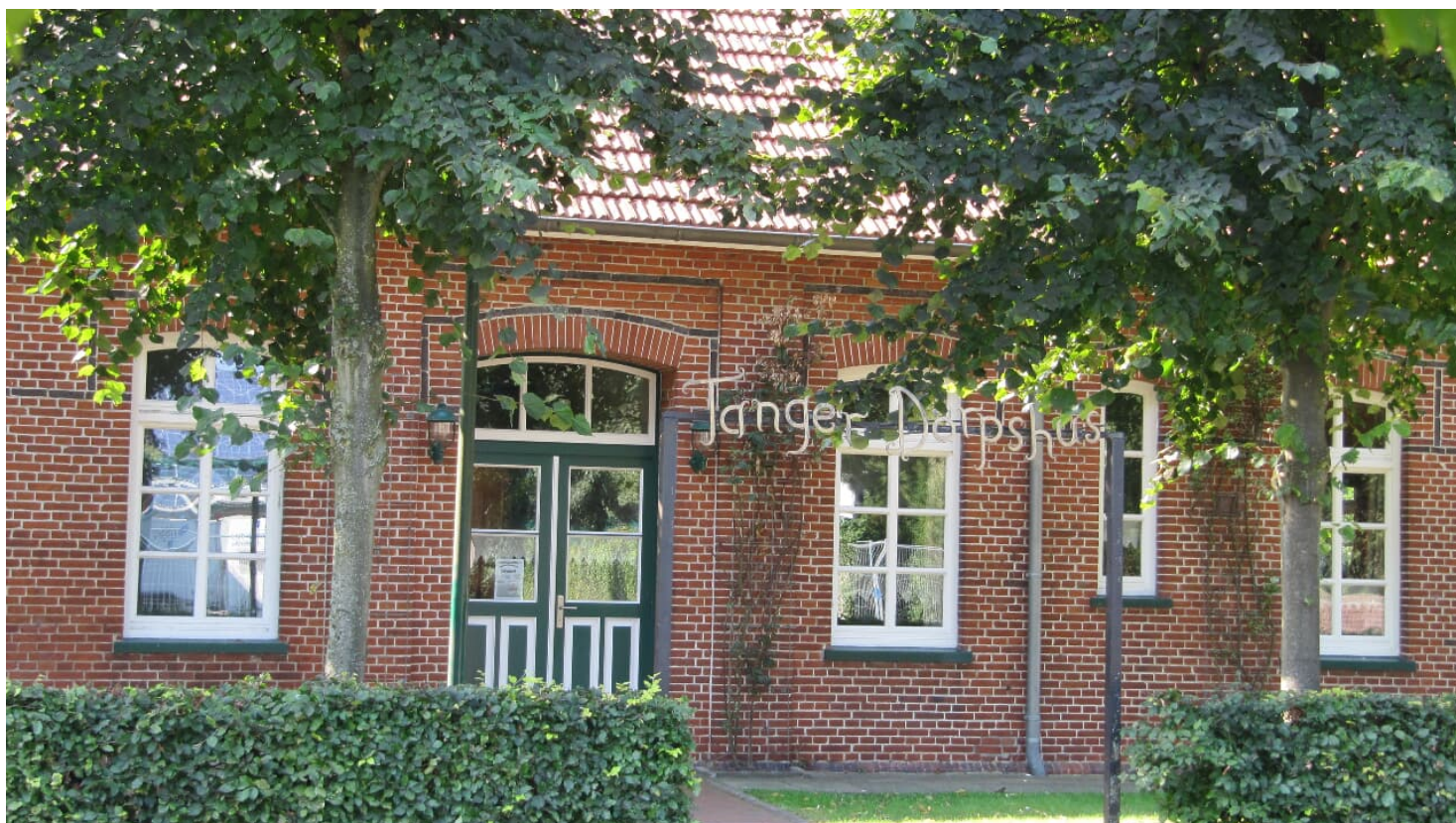
Dörpshus Tange