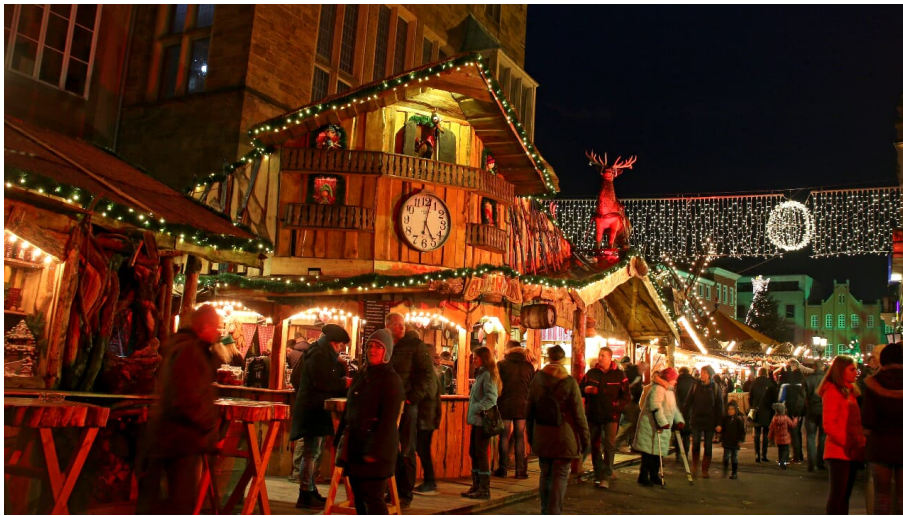
Weihnachtsmarkt minden