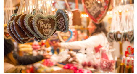
Leckereien auf dem Weihnachtsmarkt