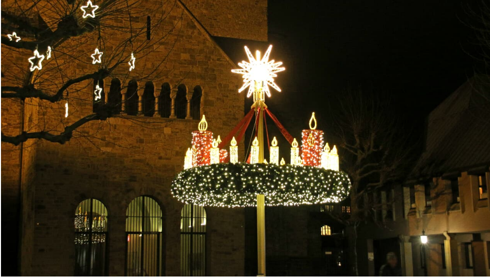
Adventskranz vor dem Dom