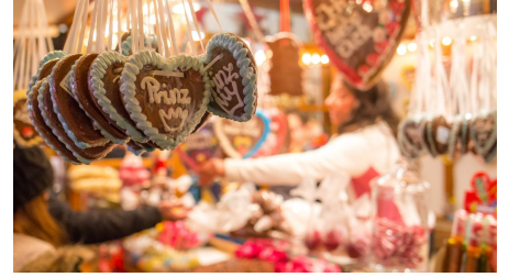
Leckereien auf dem Weihnachtsmarkt