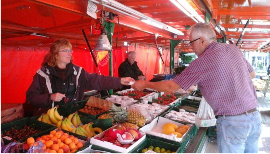
Wochenmarkt Apen