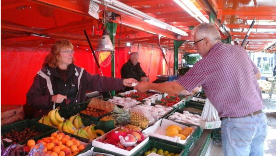
Wochenmarkt Apen