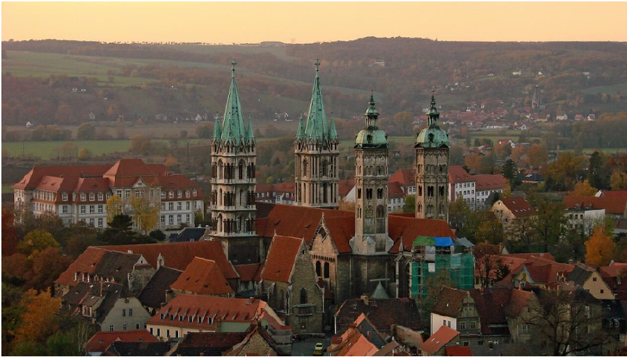
dombeisonnenuntergang_c_vereinigtedomstifter - © Vereinigte Domstifter