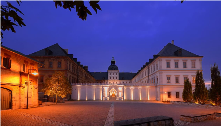
Schloss Neu-Augustusburg Weißenfels