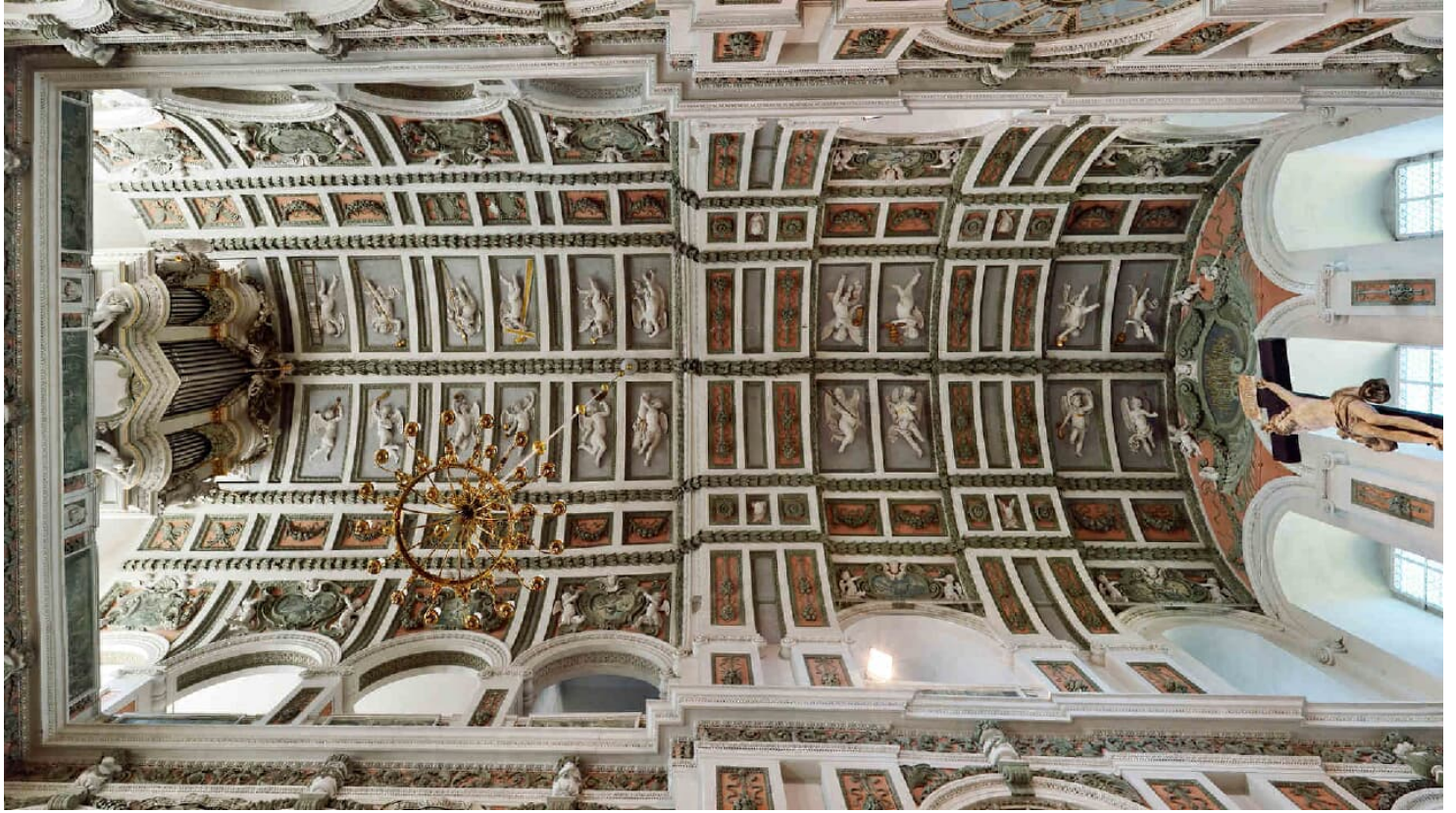
Schlosskirche Sankt Trinitatis Weißenfels