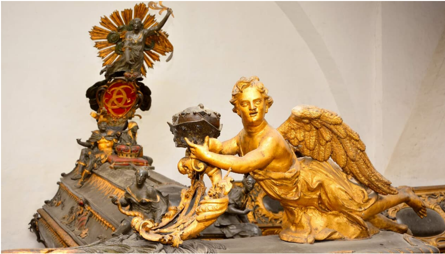
Weißenfelscher Fürstengruft