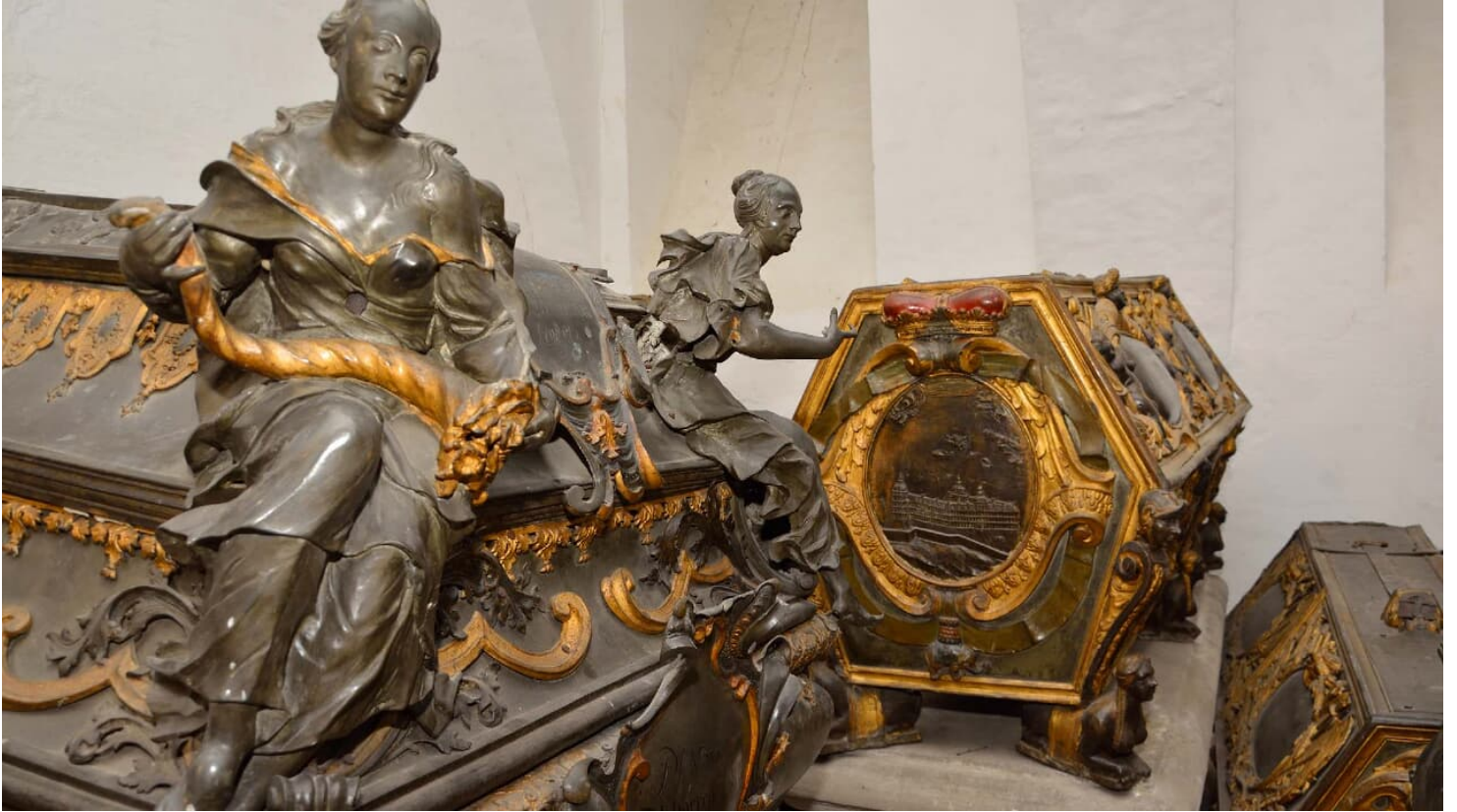
Weißenfelscher Fürstengruft Zinnargopharge