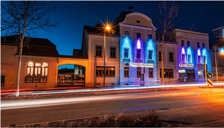
Kulturhaus Weißenfels