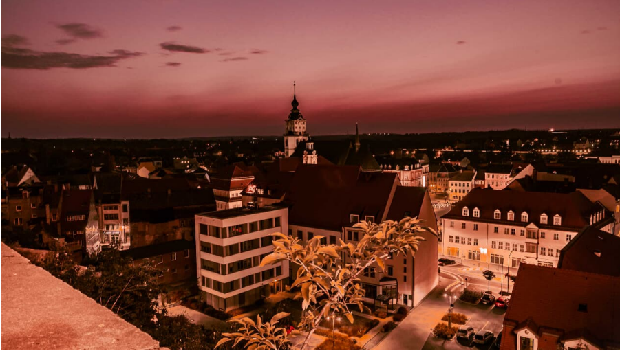
abendlicher Blick über Weissenfels an der Saale