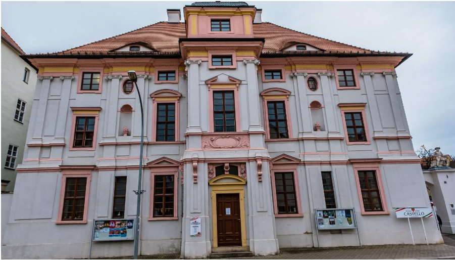
Fürstenhaus Weißenfels