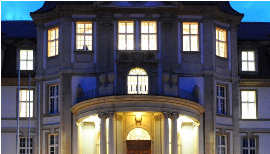
160211-OLG4.jpg - © CARDO, Torsten Biel