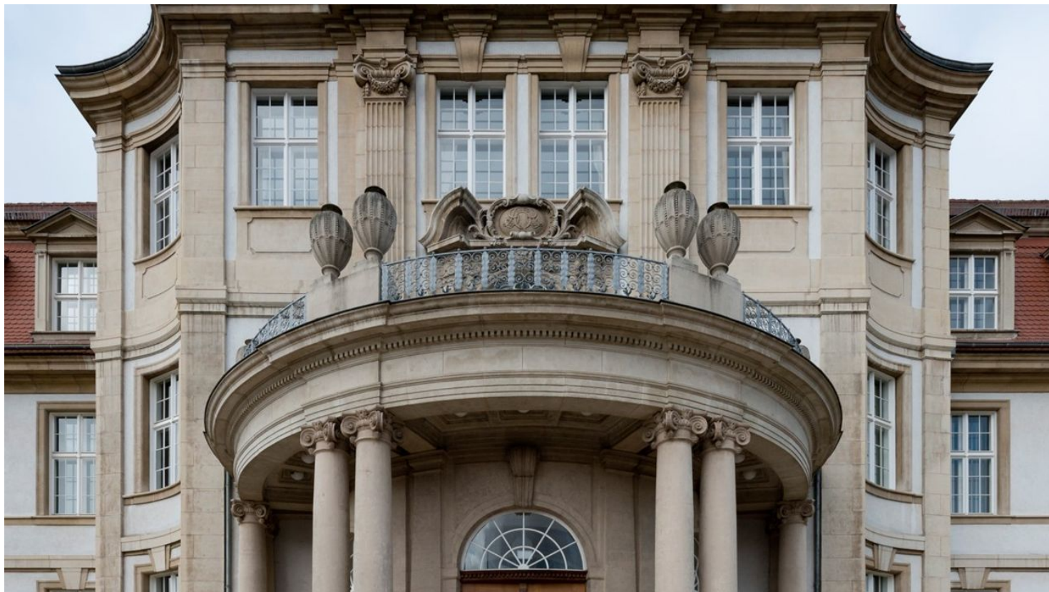
Oberlandesgericht_Kriminales und Kriminelles.jpg - © Martin Vahlbruch