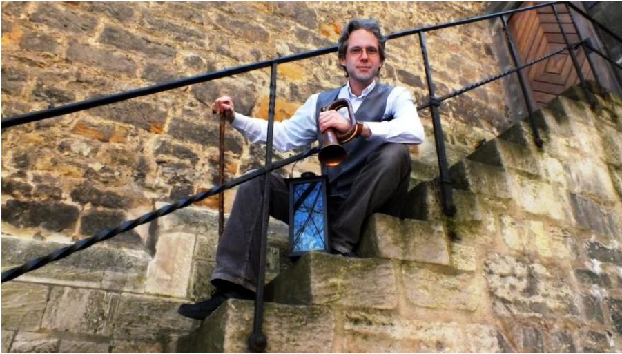
Kriminales und Kriminelles Sonderführung