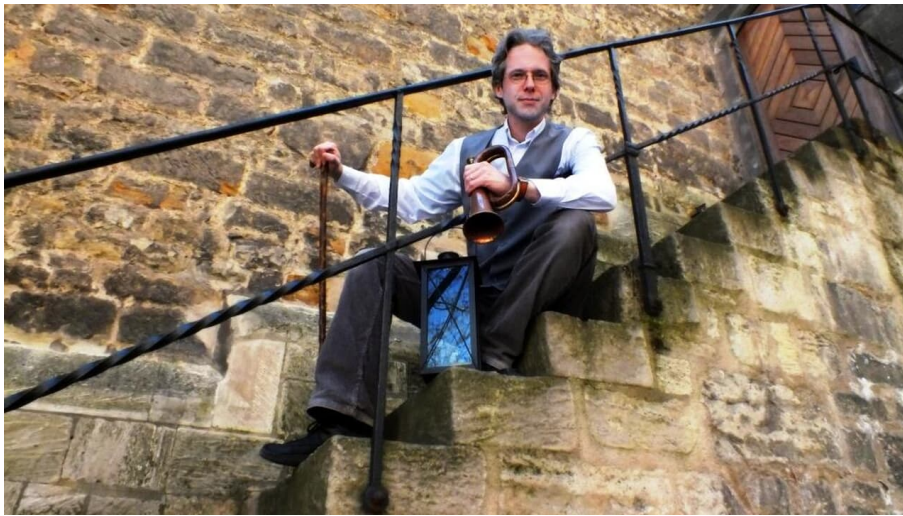
Kriminales und Kriminelles Sonderführung - © Stadt Naumburg (Saale), SG Tourismus