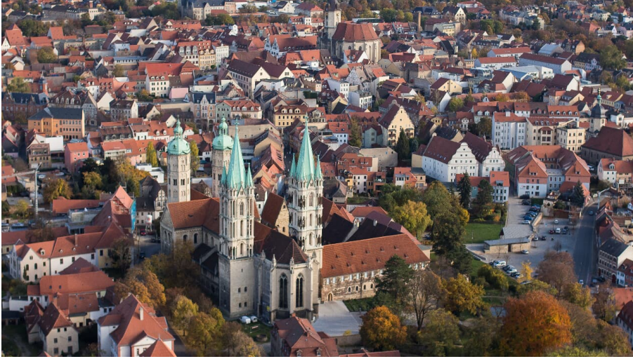
Naumburger Dom