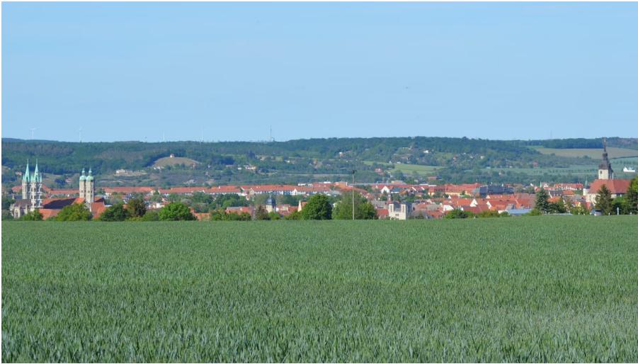
Naumburg Skyline - © Stadt Naumburg (Saale), SG Kultur