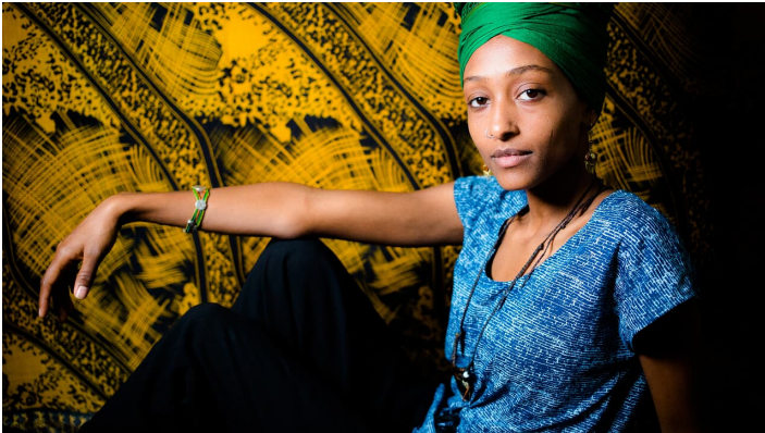
Gungun 1.jpg