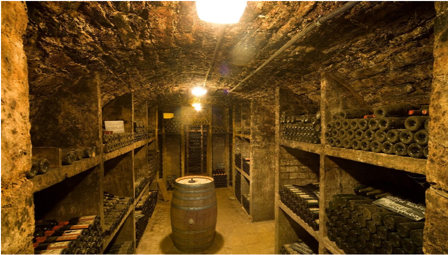
Landesweingut Kloster Pforta