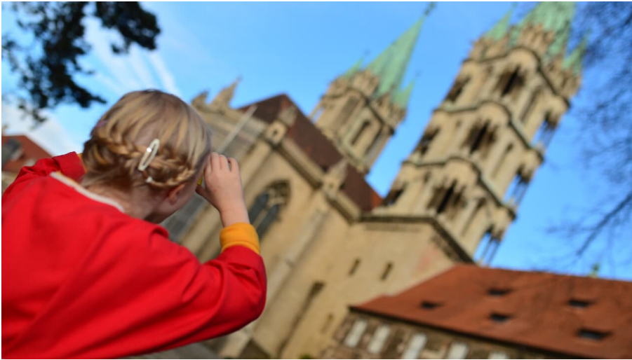
Familienführung Ich sehe was was du nicht siehst.jpg