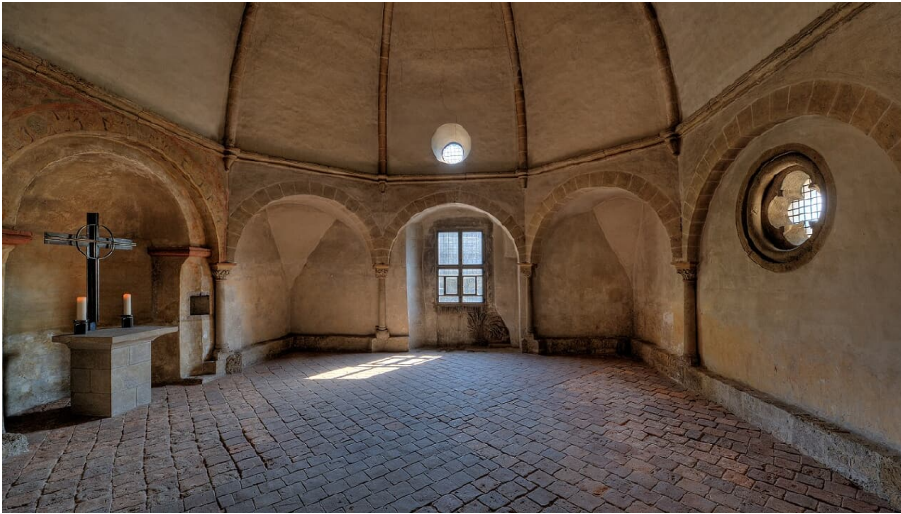
Aegidienkapelle_c_Vereinigte Domstifter_Matthias Rutkowski.jpg · © Vereinigte Domstifter, Matthias Rutkowski