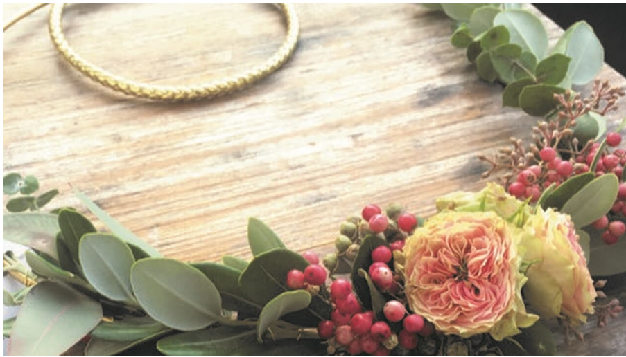
Healthy Day.jpg