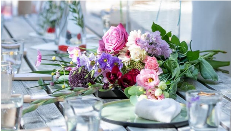
Beauty Day.jpg