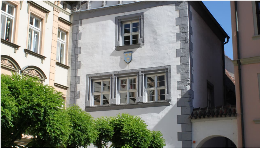
Hohe Lilie.JPG