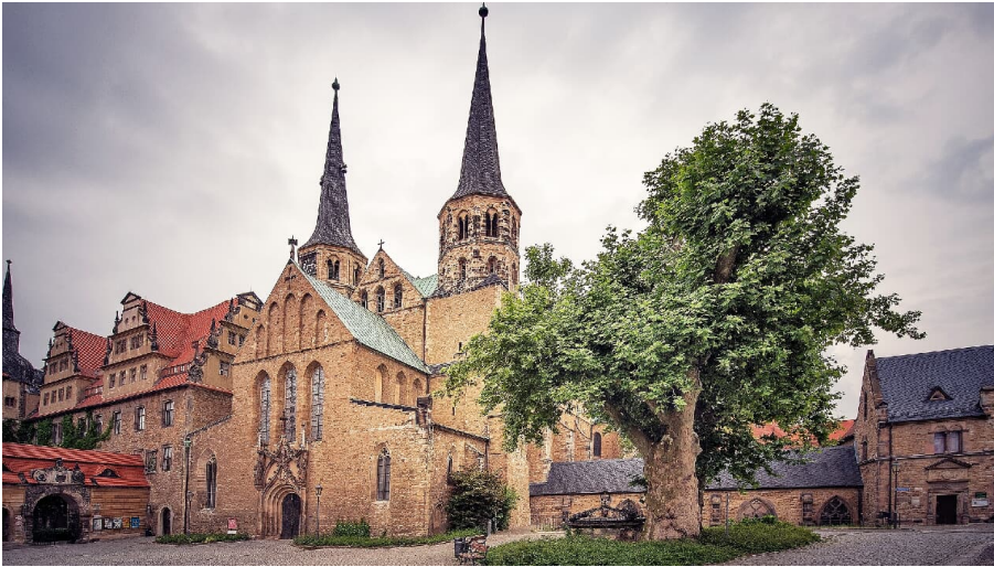
Blick auf Merseburger Dom_c_Vereinigte Domstifter_Falko Matte.jpg - © Vereinigte Domstifter, Falko Matte