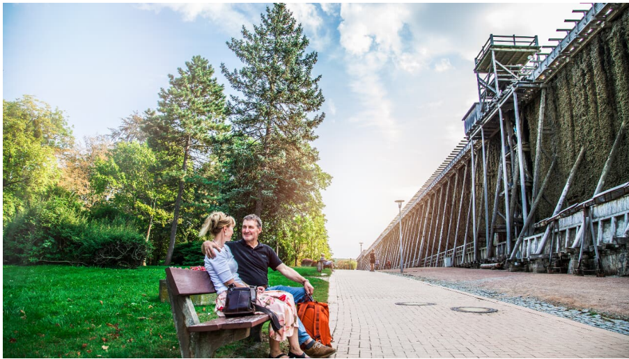
Gradierwerk Bad Kösen_Foto.SUTe.V.jpg