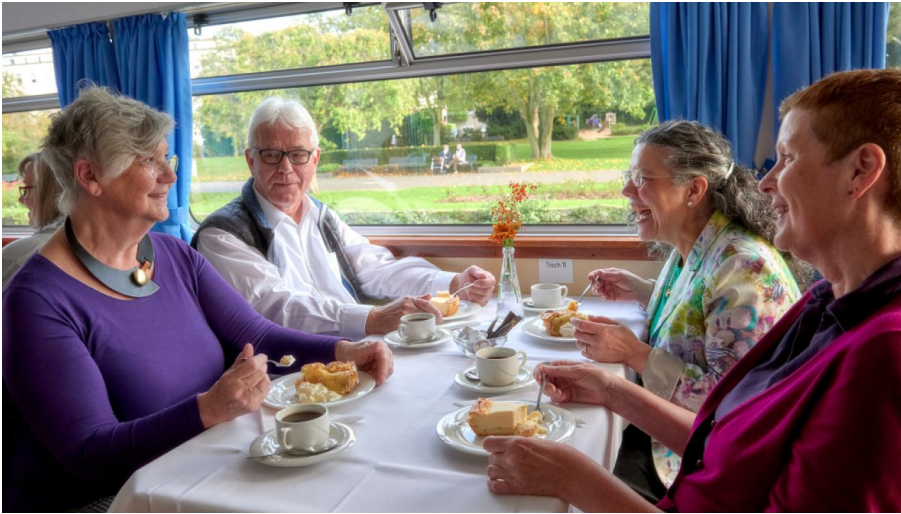
Weißer Flotte Mülheim an der Ruhr