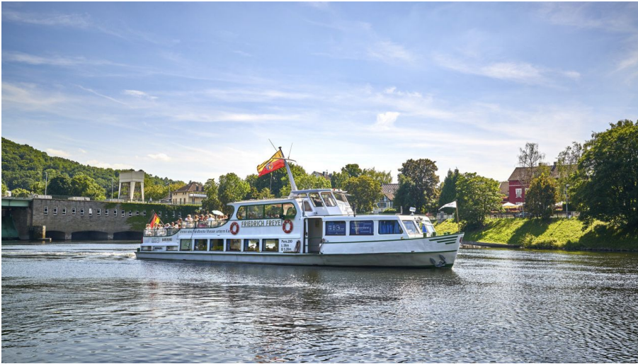
Panoramatour ins Bergische Land