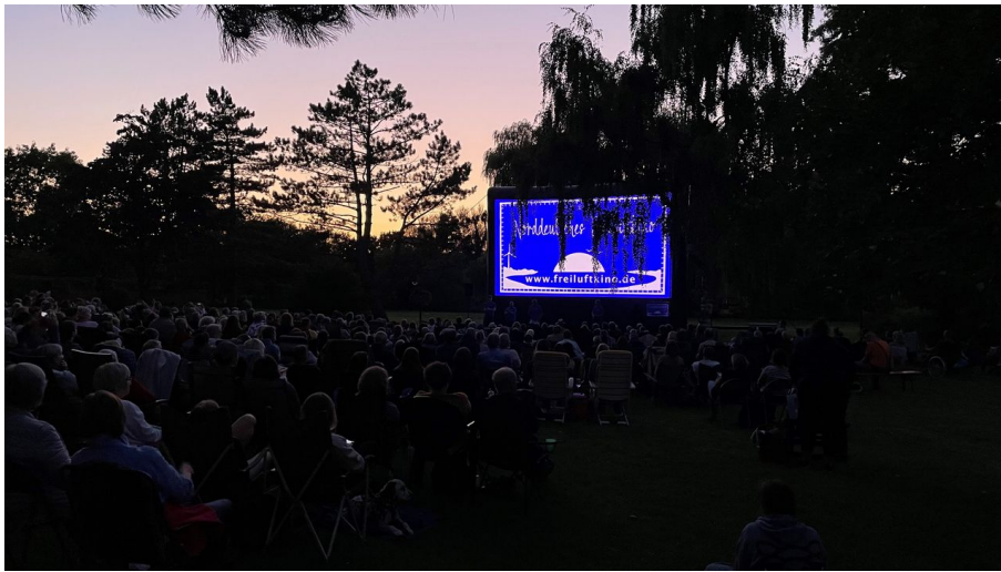
Norddeutsches Freiluftkino