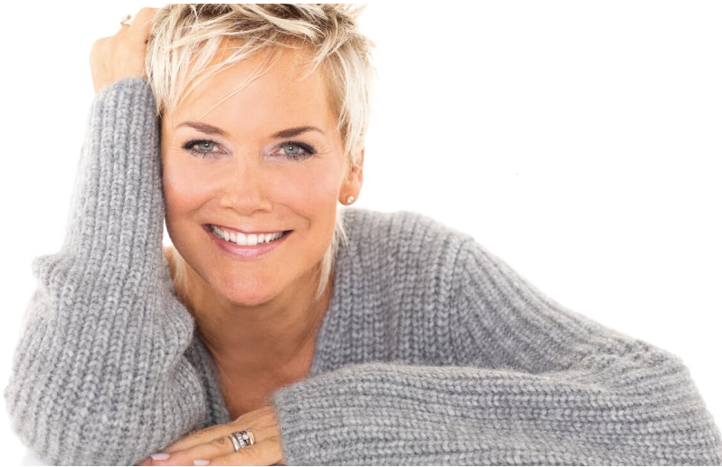
INKA BAUSE

VERLEGT VOM 11.11.2021 und 11.03.2022 auf den 04.11.2022 Tickets behalten ihre Gültigkeit