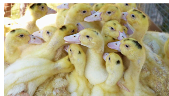
Anntag in Brakel