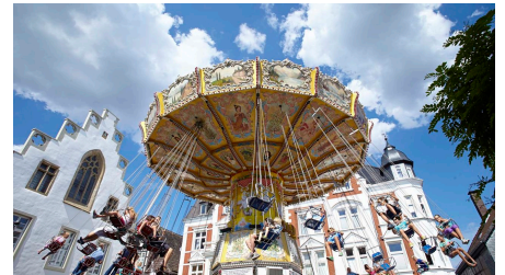
Anntag in Brakel