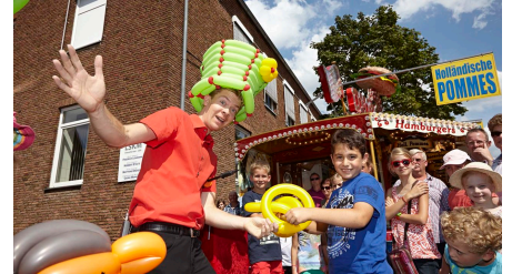
Anntag in Brakel