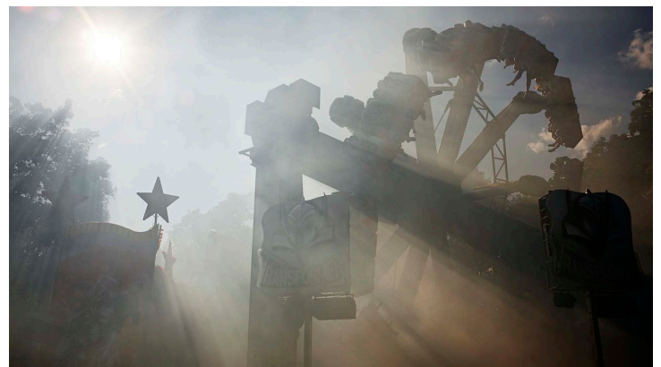
Anntag in Brakel - © Teutoburger Wald/Stadt Brakel/Matthias Groppe