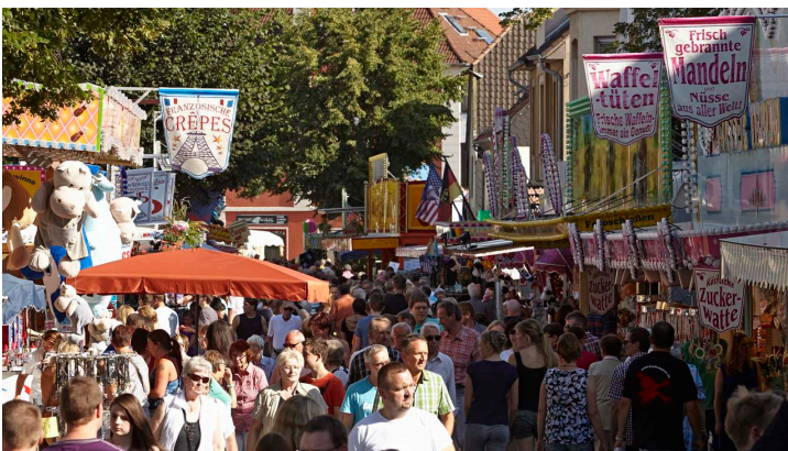
Anntag in Brakel