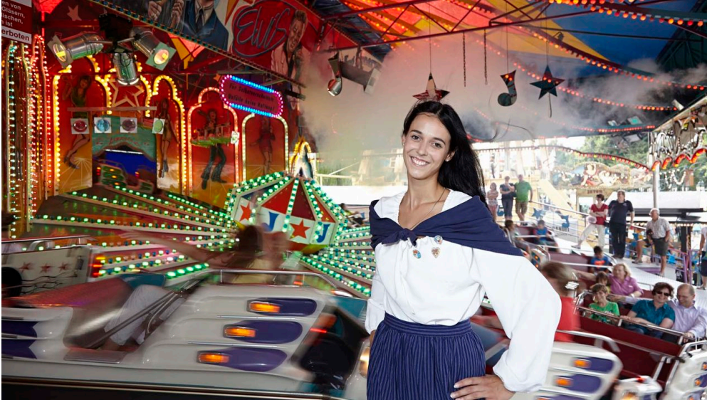
Anntag in Brakel

Der Anntag erstreckt sich über die gesamte Innenstadt.