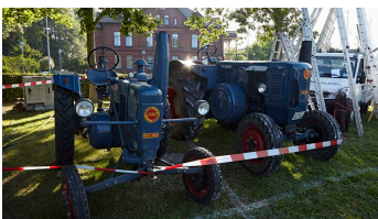
Anntag in Brakel - © Teutoburger Wald/Stadt Brakel/Matthias Groppe