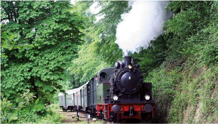
Ruhrtalfahrt für Bahnromantiker - © Hespertalbahn e. V.