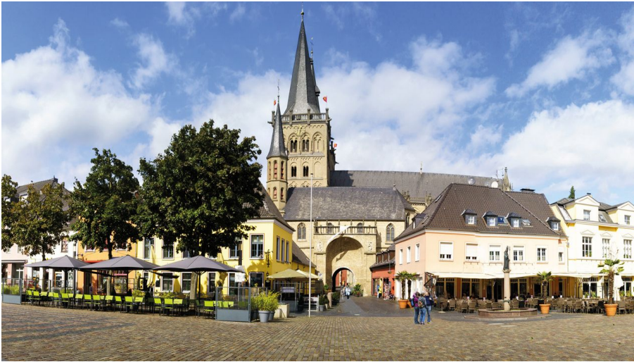
Tagesfahrt zum Xantener Dom